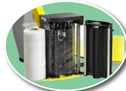
Chargement du film rapide et facile

Emballer votre palette en moins d'une minute... peu importe la dimension, la forme et le poids.