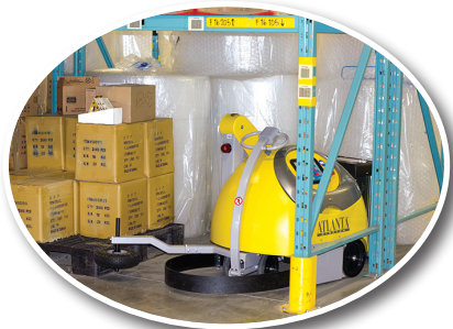
Stationnez facilement à l'écart